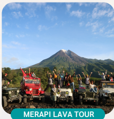
MERAPI LAVA TOUR