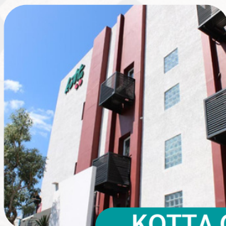
KOTTA GO HOTEL