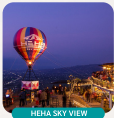
HEHA SKY VIEW